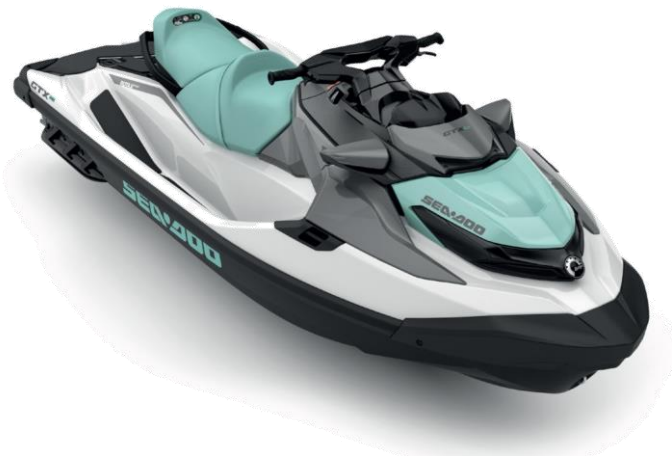
Светло-зеленый с белым